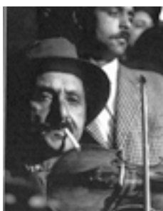
"La Chunga" 1993