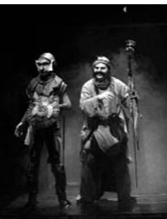
"Don Quichotte - Tome 2" 2008