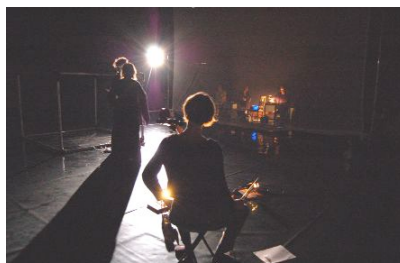
Une salle de création 250 m2 - Lyon

L'Ardoise rassemble des professionnels du spectacle, portés par la nécessité d'éprouver de nouvelles expériences théâtrales. Les locaux, mis à disposition par la Ville de Lyon, constituent aujourd'hui, après l'Ecole, le deuxième poumon de Premier Acte.