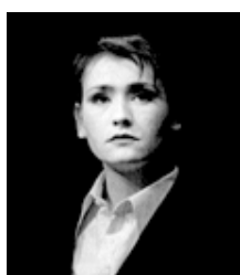
"La Voix Humaine" 1990