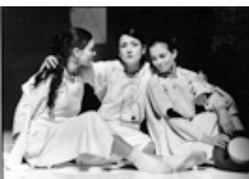
"Les Trois Soeurs" 2002